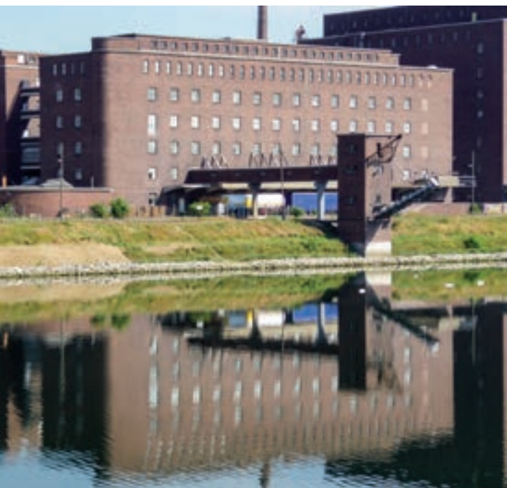
GEG am Industriehafen

Beim Gang durch die Höfe erzählen wir über die hier produzierten GEG-Eigenmarken und die genossenschaftlichen Grundsätze, über die Einverleibung durch die Nationalsozialisten, die Nachkriegszeit und über das Scheitern von coop in den 1980er Jahren. Heute beherbergen die kolossalen Bauten Handwerker, Künstler und Büros und dienen als Speziallager.