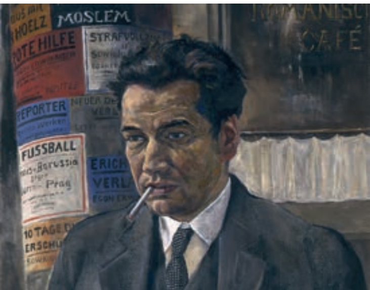
Rudolf Schlichter, Bildnis Egon Erwin Kisch

Kooperationspartner: Kunsthalle Mannheim