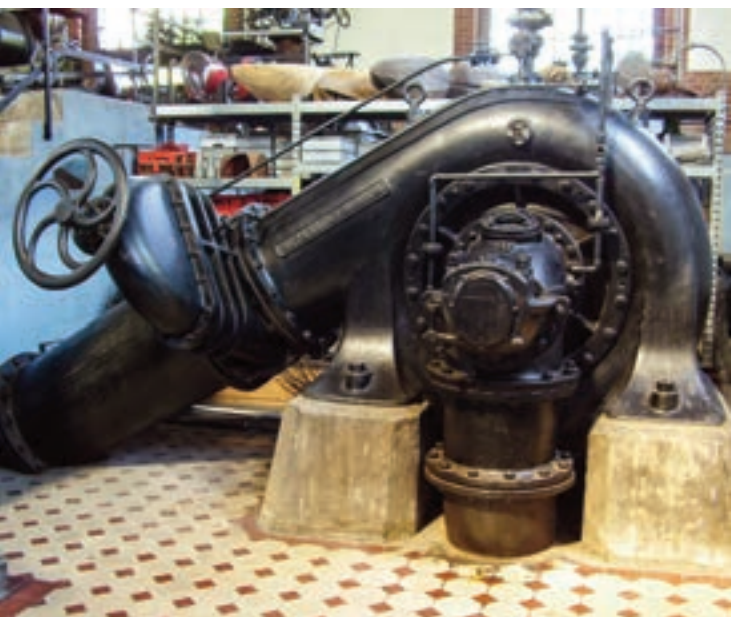
Großes Pumpenhaus

Mannheims erstes Klärwerk war von 1905 bis 1973 voll in Betrieb. Die Architektur von Stadtbaumeister Richard Perrey erinnert eher an eine Kapelle als an eine Kläranlage. Die alten Pumpen, Klärbecken und unterirdischen Gänge: alles noch erhalten.