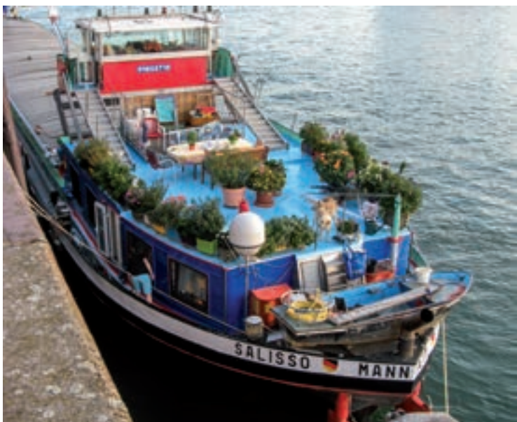
Die „Salisso“ 2015