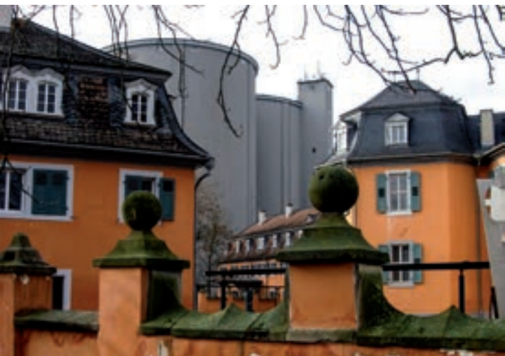
Eremitage und Zuckerfabrik Waghäusel

1995, nach 158 Jahren Produktion, wird die Zuckerfabrik mit damals 100 Beschäftigten geschlossen. Josef Mörder, ehemaliger Mitarbeiter in der Verwaltung der Zuckerfabrik, wird uns kenntnisreich durch die wechselhafte Geschichte führen.