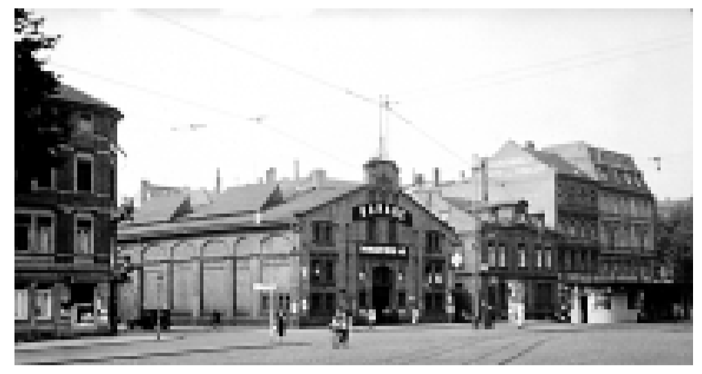
Von 1884 bis zum Ende des 1. Weltkriegs befindet sich in dem später von der Daimler-Benz AG als Garage genutzten Gebäude die Reithalle „Tattersall“. Das Foto wurde 1937 aufgenommen.