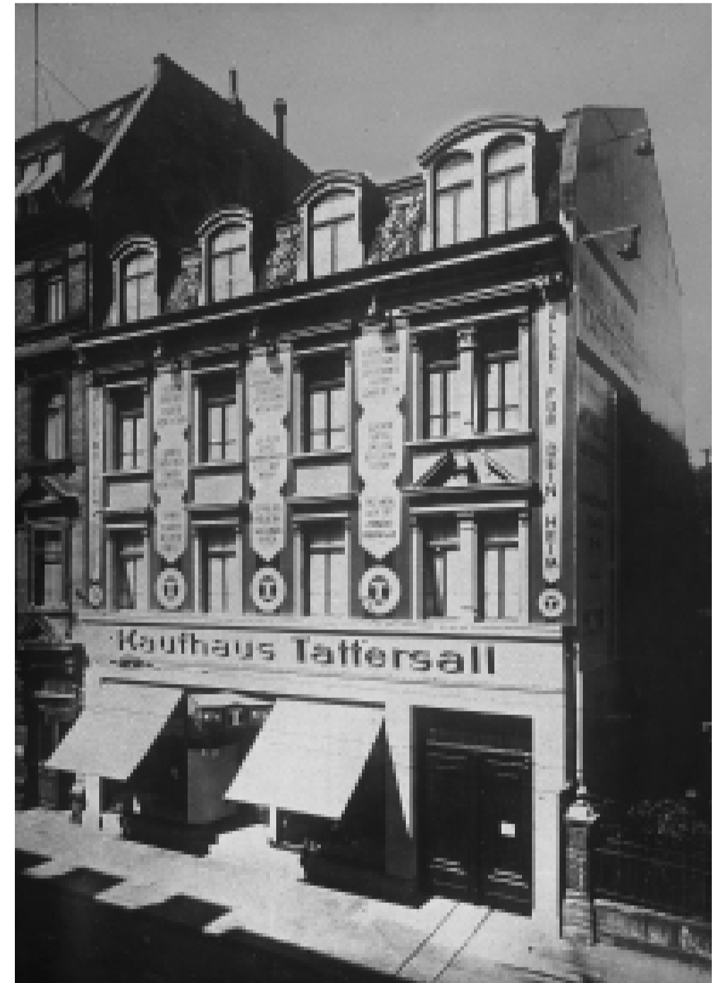
Das Kaufhaus Tattersall von H. u. F. Vetter ist die Keimzelle des späteren Kaufhauses Vetter. Foto um 1930.