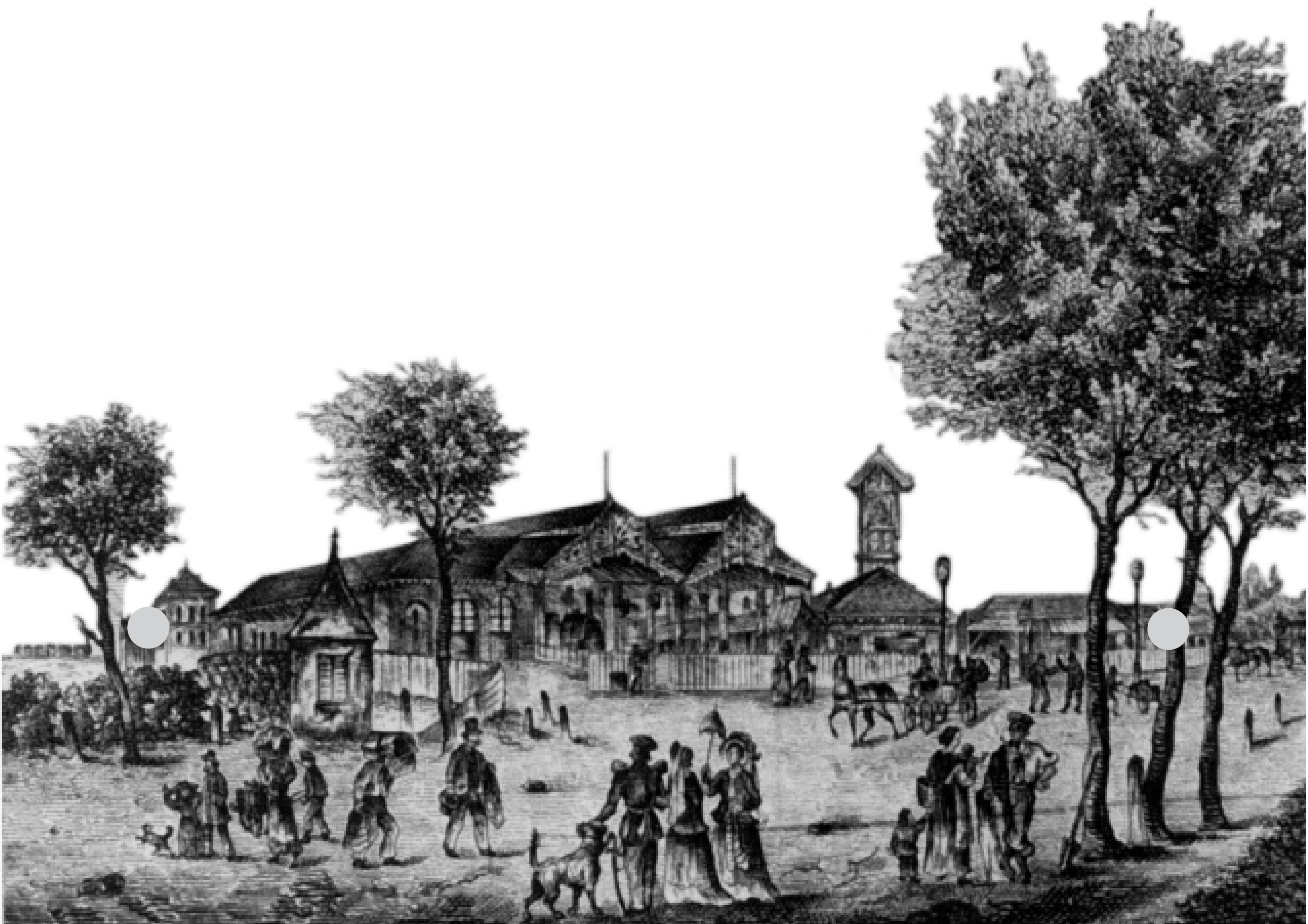
Der erste Personenbahnhof im Jahr 1864.