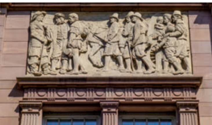
Empfang der wallonischen Einwanderer durch Kurfürst Karl Ludwig Relief in Mannheim, B2,1

In Kooperation mit dem Stadtarchiv Mannheim / Institut für Stadtgeschichte